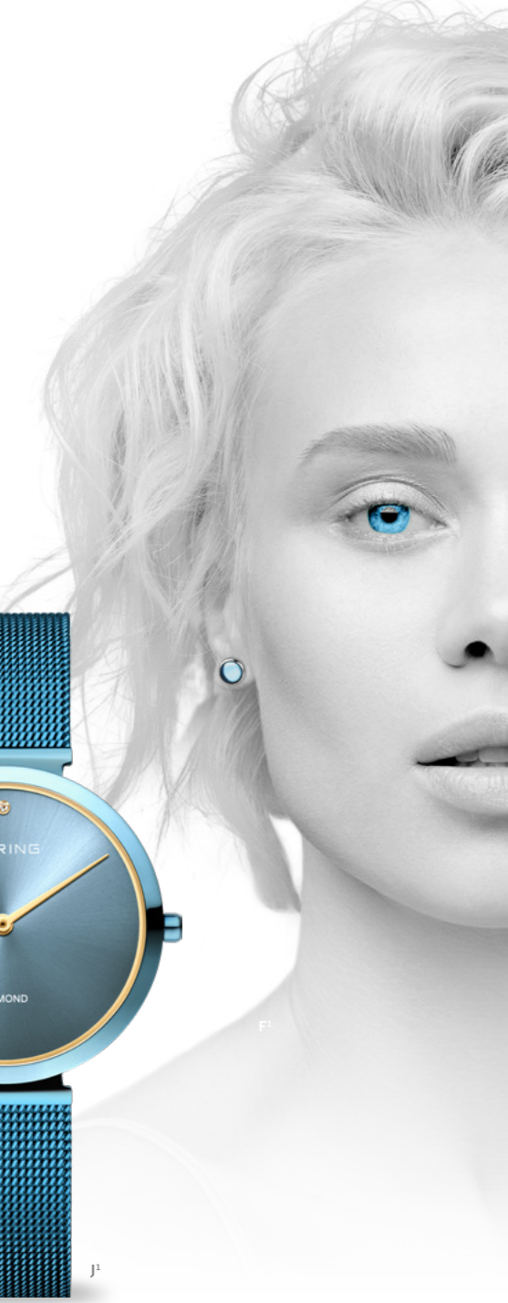
A¹. Uhr: €199,- | B¹. Uhr: €169,- | C. Kette: €49,- | D². Ringkombination: €124,90 | E. Ohrstecker: €39,90 F¹. Uhr: €189,- | G¹. Uhr: €199,- | H¹. Uhr: €169,-

*Kratzfestes Saphirglas. ²Versteckte Gravur innenliegend. 3 Jahre internationale Garantie auf Uhren (Schmuck 2 Jahre). Dänisches Design.